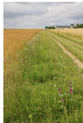
Aménagements agroécologiques des bordures de champs et pieds de pylônes.

52 projets accompagnés sur la programmation 2014-2023.