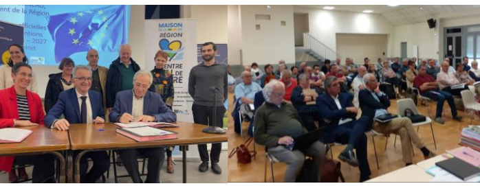
Signature du programme LEADER 2023-2027

3 collèges : élus, acteurs locaux et partenaires C'est une instance consultative sur la transition écologique