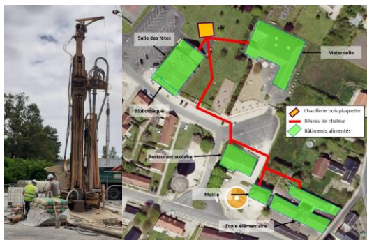
Forage géothermique au BRGM et réseau de chaleur bois-énergie à Huisseau-sur-Mauves.

Dispositif visant à développer les énergies renouvelables thermiques auprès des acteurs des territoires ruraux de l'Orléanais (collectivités, entreprises, agriculteurs...). Ces derniers peuvent bénéficier de conseils gratuits auprès d'experts, et de subventions pour des études de faisabilité et des projets d'investissement. Energies ciblées